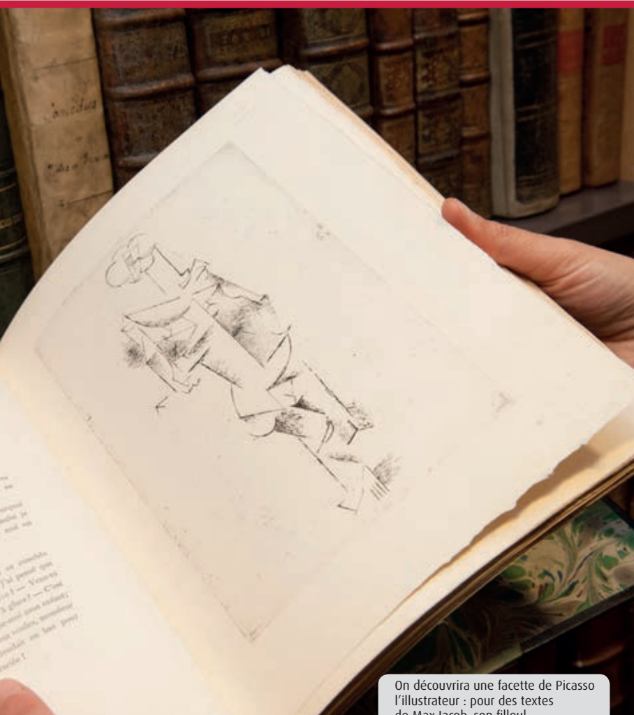
On découvrira une facette de Picasso l'illustrateur : pour des textes de Max Jacob, son filleul.