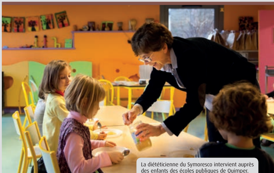
La diététicienne du Symoresco intervient auprès des enfants des écoles publiques de Quimper.