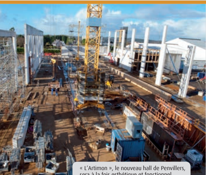
« L'Artimon », le nouveau hall de Penvillers, sera à la fois esthétique et fonctionnel.