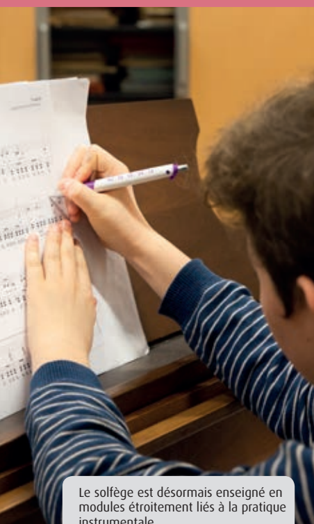
Le solfège est désormais enseigné en modules étroitement liés à la pratique instrumentale.