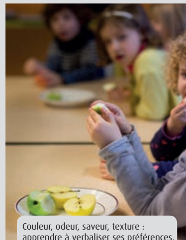
Couleur, odeur, saveur, texture : apprendre à verbaliser ses préférences.

La formation des agents de la collectivité par la diététicienne du Symoresco a été menée en deux phases, l'une sur le terrain, dans les deux écoles pilotes, l'autre plus théorique, courant février. Les animateurs commenceront à proposer les ateliers « cinq sens » aux enfants dans les écoles de la ville, à compter de la rentrée des vacances d'hiver.