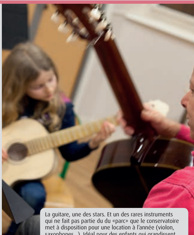
La guitare, une des stars. Et un des rares instruments qui ne fait pas partie du « parc » que le conservatoire met à disposition pour une location à l'année (violin, saxophones...). Idéal pour des enfants qui grandissent...