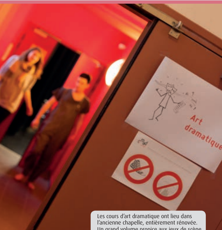
Les cours d'art dramatique ont lieu dans l'ancienne chapelle, entièrement rénovée. Un grand volume propice aux jeux de scène.