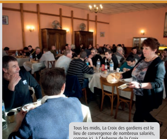
Tous les midis, La Croix des gardiens est le lieu de convergence de nombreux salariés, comme ici, à l'Auberge de la Croix.

usagers. Certains conducteurs s'y arrêtent brièvement pour se rendre dans les commerces du quartier, la majorité laisse son véhicule pour prendre les transports en commun et se rendre au centre-ville. « C'est très pratique, sourit