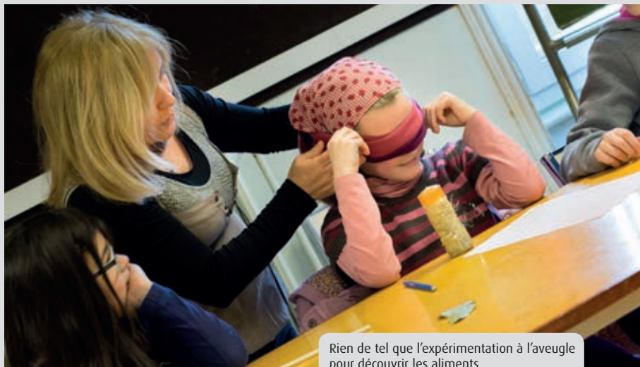
Rien de tel que l'expérimentation à l'aveugle pour découvrir les aliments.

Les services de l'enfance de Quimper et le Symoresco (cuisine centrale) travaillent ensemble sur des « ateliers du goût ». Une première période d'expérimentation a démontré son intérêt pour les enfants. Ces ateliers seront progressivement déployés dans les écoles de la ville.