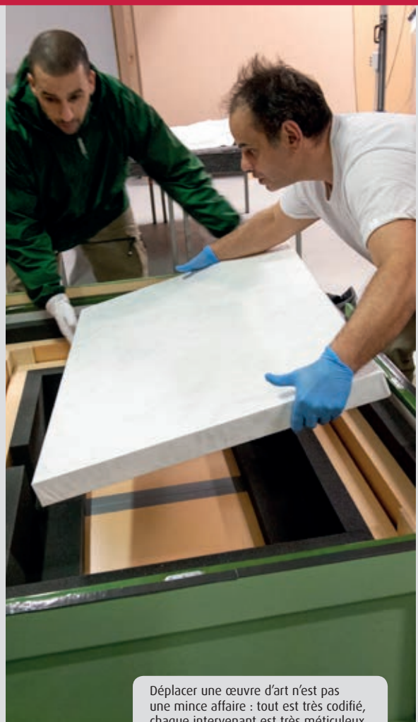
Déplacer une œuvre d'art n'est pas une mince affaire : tout est très codifié, chaque intervenant est très méticuleux.