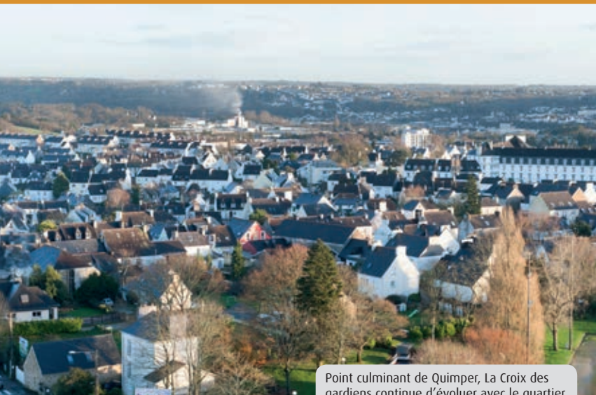
Point culminant de Quimper, La Croix des gardiens continue d'évoluer avec le quartier.

VIE DE QUARTIER | C'est l'un des points culminants de Quimper. Sur les hauteurs de Kerfeunteun, La Croix des gardiens est aussi l'une des entrées de la ville où l'on s'arrête volontiers pour boire un café, déjeuner, acheter son journal, faire quelques emplettes... Ce bout de Penvillers possède bien des atouts. La réhabilitation du Pavillon et la construction du nouveau hall « L'Artimon » vont renforcer indéniablement son image. Petit tour d'horizon.